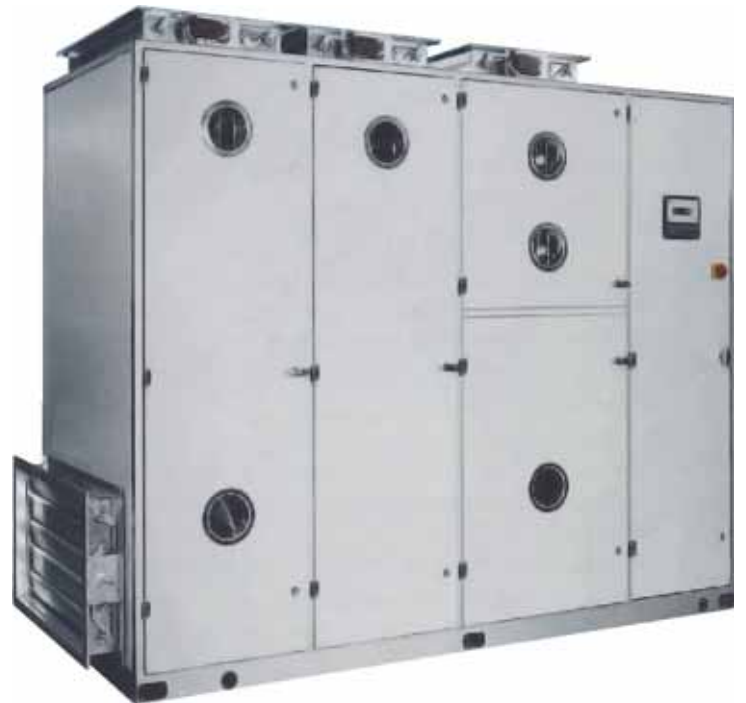
Serie H Acondicionadores de aire para quirófanos